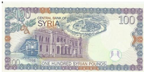
Billet de 100 pounds Syrien

Le premier chemin de fer en Syrie a ouvert lorsque le pays faisait partie de l'empire Ottoman (ligne à partir de Damas à Beyrouth ville portuaire), actuel Liban. En 1895, 2750 kms de voies étaient exploitées en traction diesel.