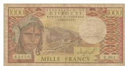
Billet de 1000 francs de Djibouti

Le réseau gouvernemental du Sri-Lanka a commencé en 1864 pendant la période coloniale, Il couvre un large réseau qui s'étend à travers l'île. Il comprend 9 lignes rayonnant de Colombo.