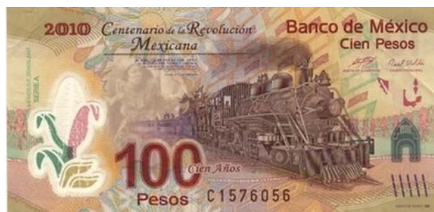
Billet de 100 pesos du Mexique 2010 Centenaire de la révolution.

Machines à vapeur Chinoises, Billets de 5 yuan (1914) et 10 yuan(1941). Le réseau chinois est le deuxième du monde avec 100 714 kms de voies fin 2013. Plus de 13000 kms de voies rapides type TGV, le premier du monde, avec 2000 milliards de $ d'investissements. Le premier train a roulé en 1876 à Shanghai. Actuellement la Chine est desservie par 20 lignes principales.