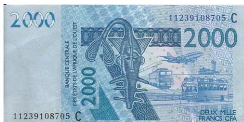
Billet de 2000 francs Cfa du Sénégal (des Etats de l'Afrique de l'Ouest)