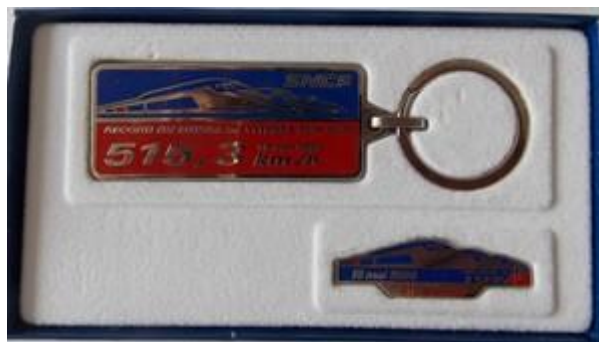
France coffret TGV

Coffret pour tous les cheminots lors du record du monde de vitesse sur rail 515,3 kms/h établi le 18 mai 1990. Actuellement le record est de 574,8kms/h. A sa sortie ce coffret se négociait autour de 600€.